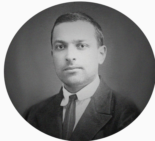
Л. С. ВЫГОТСКИЙ