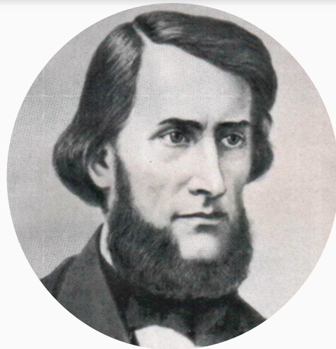
К. Д. УШИНСКИЙ