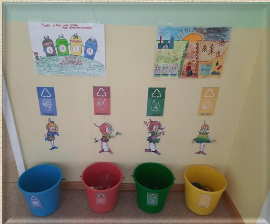
Центр по сортировке мусора