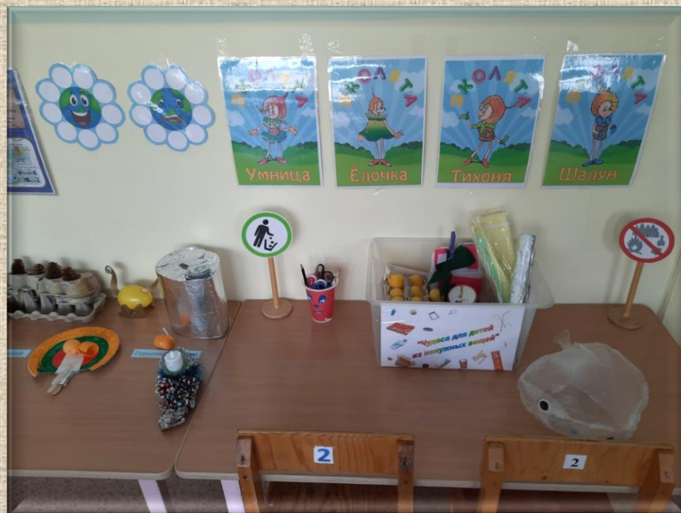
Центр по переработке мусора «Эколята»