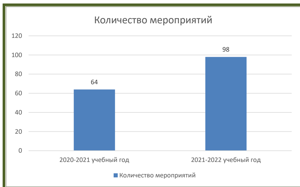
Таблица 2. Количественные показатели по реализации проекта в 2021-2022 учебном году