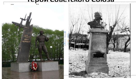
Рисунок 4. Титульный лист мини-проекта «Томичи – Герои Советского Союза»

Исследовательская, поисковая деятельность обучающихся вызывает большой интерес к истории, людям, её создающим, желание поделиться своими открытиями со сверстниками, родителями, педагогами. Школьники представляют проекты на мероприятиях разного уровня: от школьного до Международного, их работы всегда вызывают живой и неподдельный интерес. Слушатели отмечают глубину, новизну, огромный объём материала, освоенный учащимися (на рисунке 5 представлен фрагмент меню проекта «Томск в годы Великой Отечественной войны»).