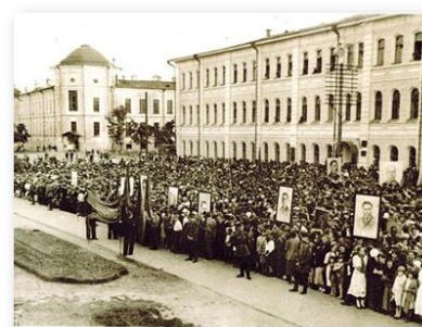
Митинг трудящихся Томска 22 июня 1941 года

Узнав о начавшейся войне, томичи в 16.00 собрались на митинг на площади Революции (ныне Новособорная ). Прозвучало сообщение Левитана .