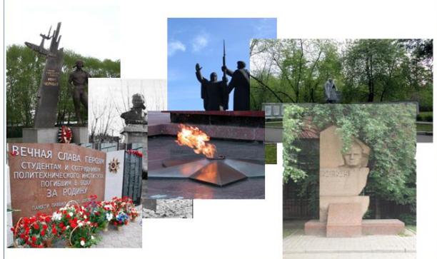
Рисунок 3. Титульный лист мини-проекта «Карта памяти»