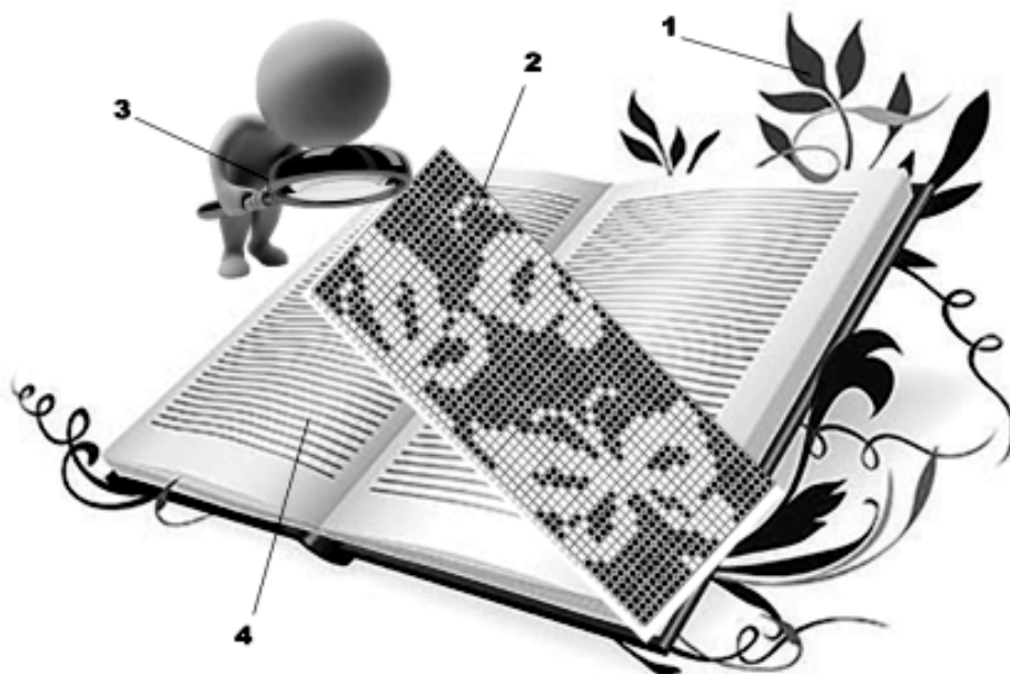
Рис.1. Образ фрейма «сквозного» содержания для УР