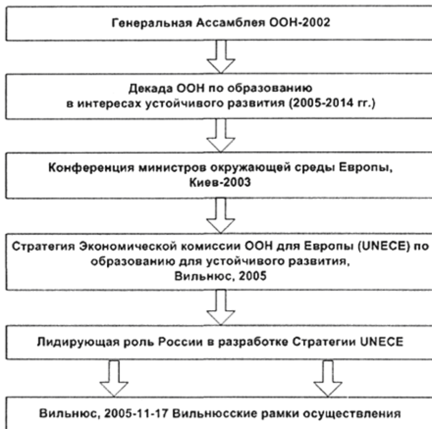
Таблица 4. Организационные рамки становления ОУР в Европе

Национальный план действий по осуществлению ОУР должен учитывать фактическое состояние дел в стране, выявить приоритеты и определить график выполнения в соответствии со Стратегией UNECE и мероприятиями ЮНЕСКО в рамках Десятилетия ООН по ОУР. Национальный план действий должен предполагать поощрение действий по интеграции идей ОУР в политику, образовательные стандарты, учебные программы и планы на всех уровнях системы образования и переподготовки кадров (табл.5), развитие научных исследований по ОУР, а также тесное международное сотрудничество.