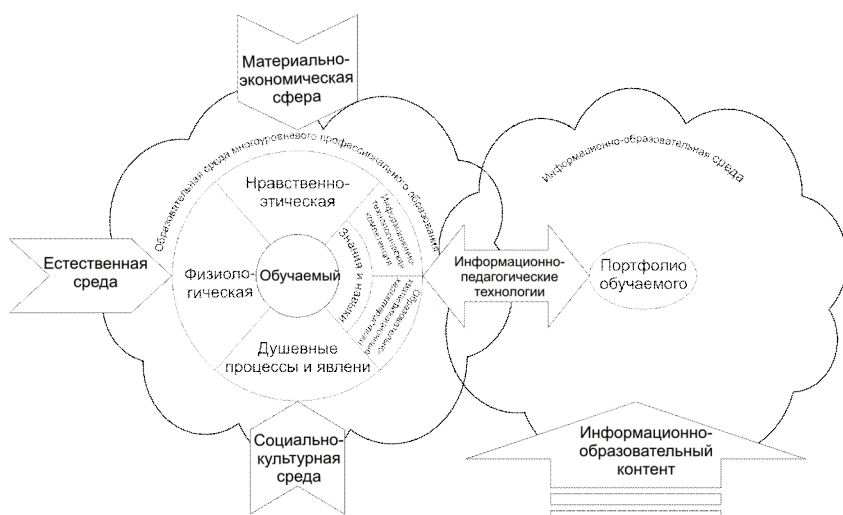
Рис. 2. Нормативная модель обучаемого в общей структуре ИОС в области ОУР

Дидактические возможности ИОС позволяют обеспечить непрерывность, вариативность образования, а также практически отразить на практике принципы открытого образования.