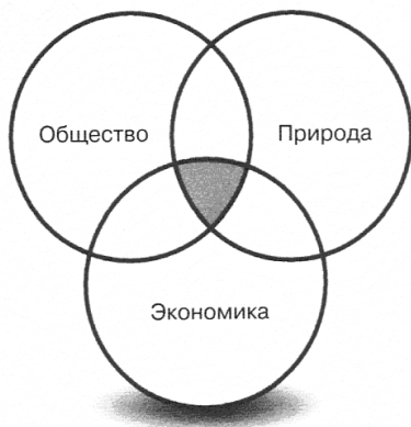
Рис. 1. Связь экологических, социальных и экономических факторов

На конференции была особо подчеркнута роль образования в процессе устойчивого развития, обобщены цели и задачи экологического образования, важнейшей из которых была названа задача: научить людей удовлетворять нынешние потребности и при этом не подвергать угрозе общее будущее. Универсальный характер идей устойчивого развития послужил основой для становления образования в интересах устойчивого развития, которое позволит обеспечить дальнейшее гармоничное развитие общества, экономики и окружающей среды.