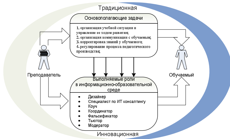
Рис. 3. Выполняемые роли педагога в ИОС

Роль педагога в организации ИОС в рамках ОУР может быть представлена следующей моделью (рис. 3).